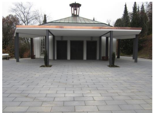
Blick auf den neu gestalteten Eingang der Kapelle

Am Rand des großen Vorplatzes wurde ein Rahmen aus Pflanzungen und Sitzbänken angelegt. Der Haupteingang wird mit zwei neuen Pflanzungen betont. Es entsteht eine Inszenierung, die Kapelle wird durch die neue Außenanlage und die erhöhte Lage am Hang zum Blickfang und zu einem besonderen Merkmal des Blumberger Friedhofs.